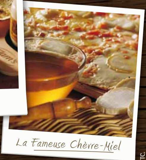
La Fameuse Chèvre-Miel

Accompagnez votre repas de salade verte assaisonnée d'une vinaigrette à la moutarde à l'ancienne